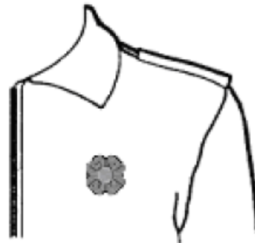
All-season jacket Manteau toutes-saisons

Wearing of the Poppy (left pocket) - Port du coquelicot (poche de gauche)